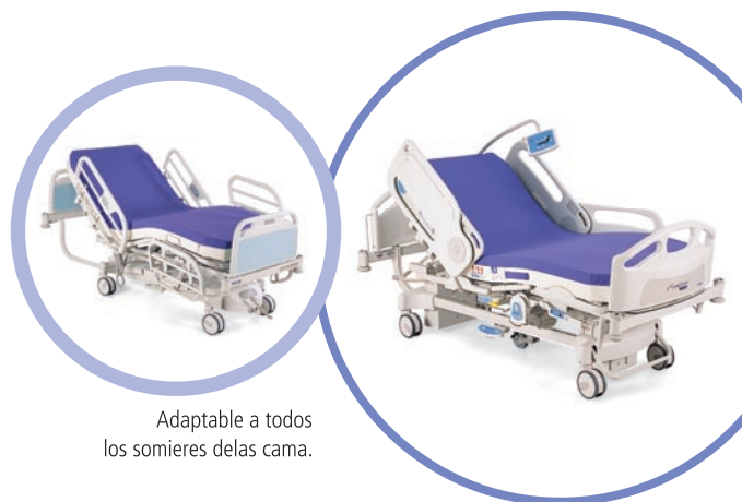
Adaptable a todos los somieres de las cama.

Alta calidad, la gama de productos elaborados con polímero viscoelástico incluye: colchones, sobrecolchones, colchones para camilla, cojines de asiento y taloneras.